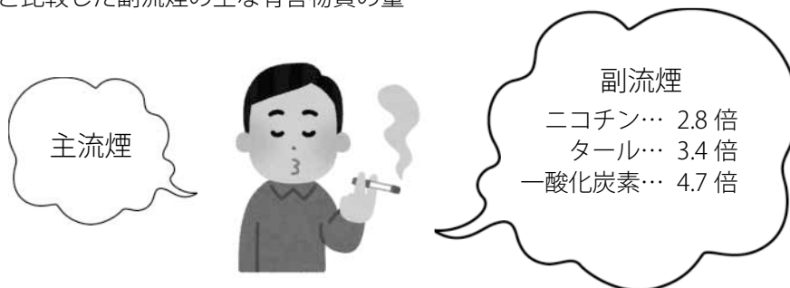
表1) 副流煙による影響