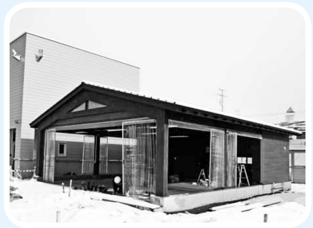
4月にオープンする『ふれあい交流館 交流広場』