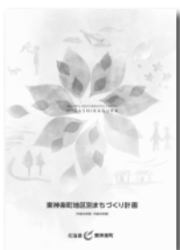
東神楽町 地区別まちづくり計画

を出し合い達成状況を確認しました。それを踏まえ、目標の追加や修正、削除を行い、最後に、目標の中でも重要度の高いもの、重点的に行うべき目標について、投票により決定しました。 地区会議を通して、7つの地区の現状を確認し、計画の中で見直すべき点、より力を入れて取り組むべき項目などができました。また、話し合いを通して、行政には何が求められているのか、町民の側から何ができるのかなど、まちづくりを考えるきっかけとすることができました。 会議の中で決定した事項やいただいたご意見につきましては、地区ごとのまちづくりの方針として生かしてまいります。