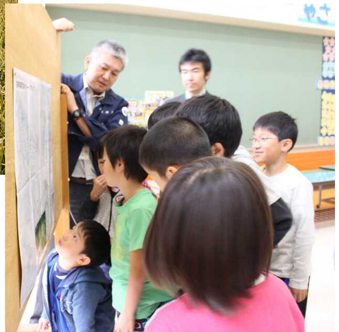
気象台による防災(地震・水害)教室 10月18日 区長さんが用意してくださったハザードマップで安全を確認