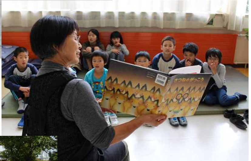
読み聞かせサークル『おうまのおやこ』のみなさんによる読み聞かせ 10月17日