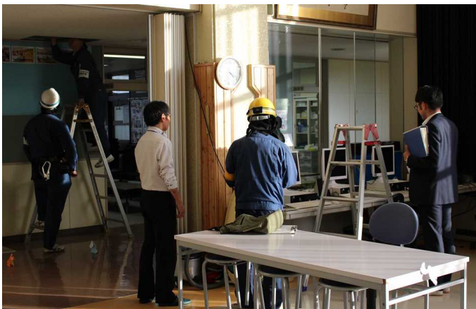
志比内にも光回線がやってきます！！ 回線の確認のため施工業者がやってきました。