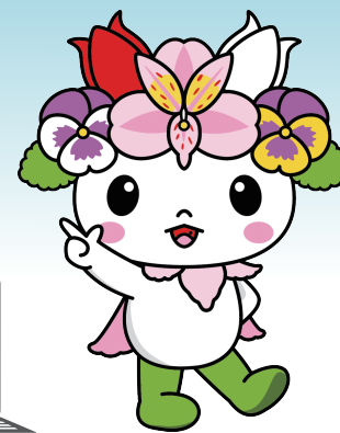
東神楽町キャラクター 「かぐらつきー」

※ブラウン管(CRT)モニターは、処理等に費用がかかるため別料金(1台3,300円※税込)となります。