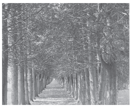
工業団地の緑地帯