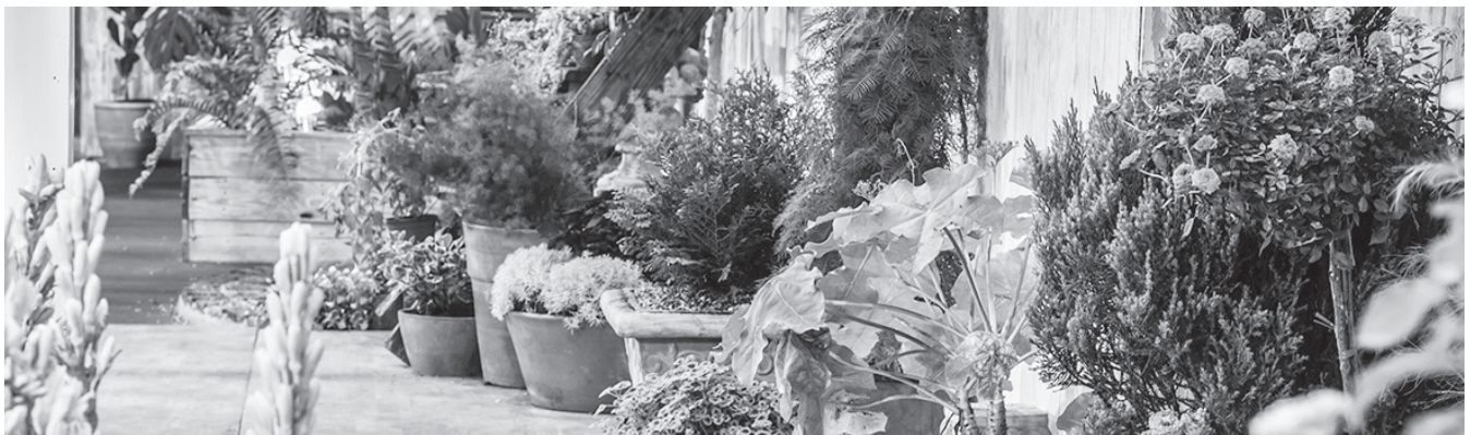
フラワーガーデンイメージ

町長答弁 地域の中で進めてきた花のまちづくりを、しっかりと見せる部分と、それと同時にこの複合施設全体の中で、町全体がひとつになるような施設と思っており、しっかりと整備をしていきたいと思えます。