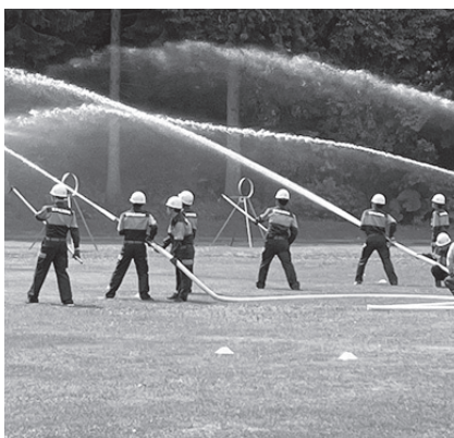
消防団による放水訓練の様子

今回の火災の原因や対応について、さらに検証を進め、火災を未然に防ぎ、被害を最小限に食い止めるよう努めます。