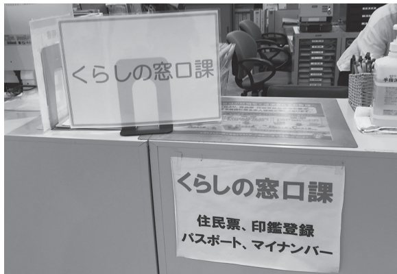
マイナンバーカードの町内受付場所

町長答弁 現在のところ、我町ではトラブルは発生していませんが、今後予定されている統合などについては、国の動向を注視していきます。