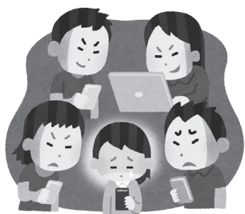
ネット「いじめ」の対策が必要です

質問 プロバイダー責任制限法に基づきネット上のいじめの対応として不適切な書き込みや児童生徒の生命、身体、財産に大きな被害が生じるときは直ちに所管警察に通報し適切に援助を求めるとあります。子どもの大切な命を守るため、親・先生などに周知を行っていただきたい。 教育長答弁 事案に事件性がある場合には早期に警察と連携を図って早期解決に努めます。