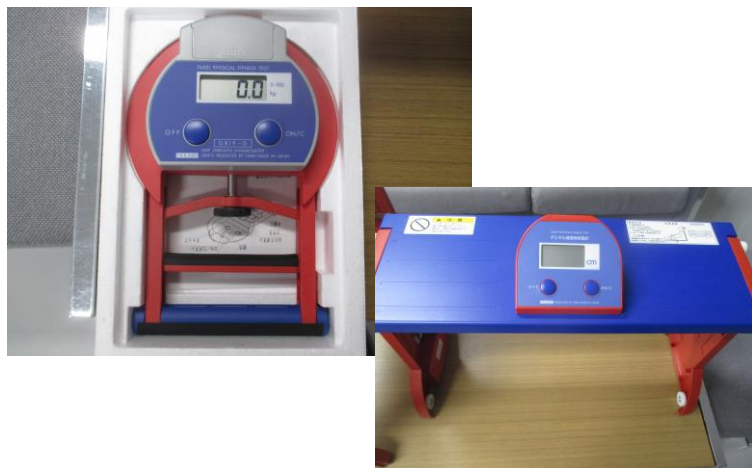
(東聖小：握力計・長座体前屈測定器)