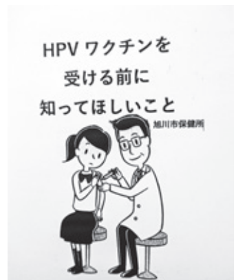
旭川市独自で出しているパンフレット