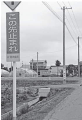
交通標識のない危険な交差点

質問 今年3月に開通をした旭川東神楽高規格道路と町道11号道路・10号道路の交差点には「この先止まれ」「一時停止」の看板が急遽設置されましたが認識しづらく、安全面は大丈夫でしょうか。 みずほ通り交差点 には「止まれ」の交通標識があるにもかかわらず、事故が起っています。これから観光シーズンを迎え交通量も増えることが予測されます。また、夕暮れが早くなる時期や冬場には雪に覆われ、さらに標識が見づらくなることも予想されます。長く町道に慣れた町民にとっては大変危険です。大きな事故が起こる前に是非とも交通標識の設置を行って頂きたい。 町長答弁 私どもも当然「止まれ」の交通標識が設置されると考えておりました。「交通標識」は公安委員会の所管ですので、当町として急遽看板を設置した次第です。議会からの声が上がったことを含め、町民の安全は勿論、再度、強く要望をいたします。