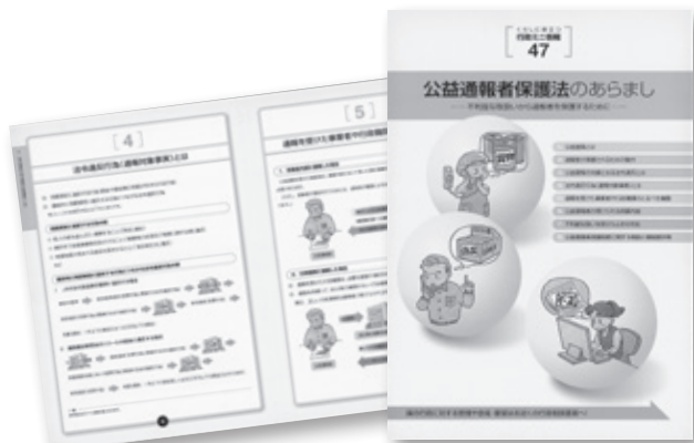
役場に置いてあるパンフレット

町長答弁 民主主義の原則の中では、うそかどうかというのは、こちらで言ってみせしめ、そういう認識していると言ふことではありません。