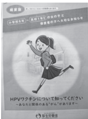
子宮頸がんパンフレット

「当町でも積極的推奨を再開し、「キャッチアップ接種」の対象者には個別に通知を致します。」 質問 確かに子宮頸がんは発見しづらく、がんの件数も増えていきます。しかし、接種対象者が小6から高1年生の子供で、まだ自己判断をするには難しいと考えます。家族と良く話し合い、理解をし納得した上で接種を受けて頂きたい。当町としての対応策をお聞かせ下さい。 町長答弁 接種対象者に子宮頸がんワクチン接種のメリット・デメリットについての理解をして頂きワクチンの効果と副反応等やワクチン相談窓口の情報を記載したチラシを同封致します。 質問 旭川市では子供でも疑問点を検索できるよう独自のパンフレットを作成し啓発を行っています。 町長答弁 今後、接種を希望する方に接種機会を逃さないよう広く周知して参ります。