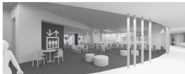
複合施設のイメージ図

プレミアム商品券は効果があると思います。今後、国の対策も含めて、生活支援など状況を見ながら、検討していきます。