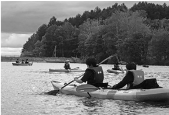
チャレンジクラブでのカヌー体験