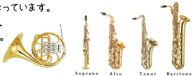
Soprano Alto Tenor Baritone