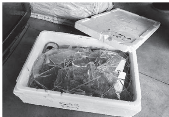
【ごみ袋が使われていません】

出し方が間違っていたり、分別のされていないごみは収集できず、ごみボックスや資源回収物置に残されます。溜まっていくと他のごみが入らなくなるなど、他の方にも迷惑がかかります。