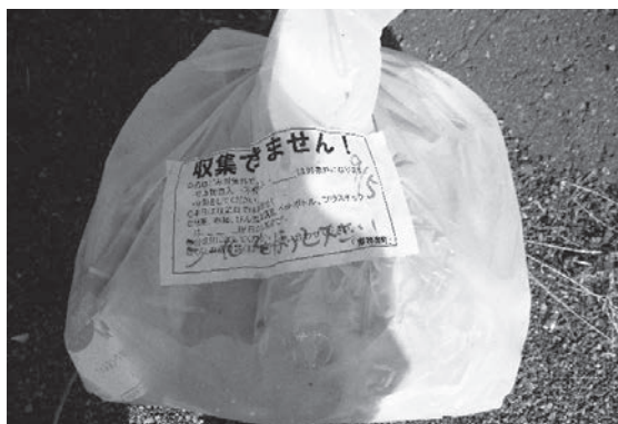
【ごみ処理券が貼られていません】